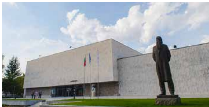
Художествената галерия Владимир Димитров – Майстора, Кюстендил

Художествената галерия „Владимир Димитров – Майстора“ се намира в Кюстендил, ул. „Патриарх Евтимий“ № 20. Тя е сред Стоте национални туристически обекта на България. На 6 август 1944 г. в кюстендилската джамия Ахмед бей по инициатива на Драган Лозенски, Кирил Цонев и д-р Георги Ефремов на основата на сбирка от 50 творби на Владимир Димитров – Майстора се открива музейна сбирка и художествена галерия. На 24 май 1959 г. се открива самостоятелно обособе-