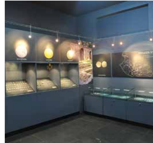
Музей, зала “Асклепий”, Кюстендил

и Хера от светилището при с. Копиловци, II в., и др. Експонирана е трако-римска четириколка от с. Радловци, III в.