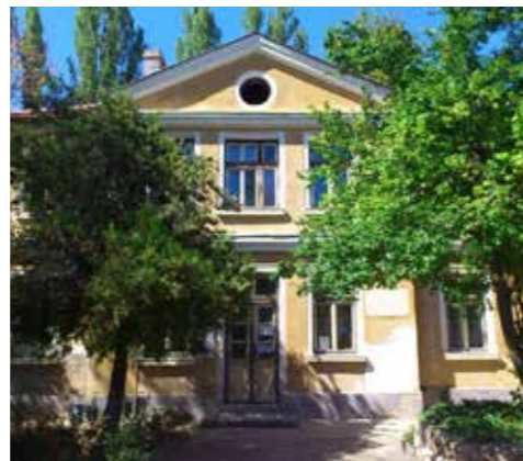
Алай Баня, Кюстендил

Алай баня (Войнишката баня) е обществена баня в град Кюстендил, построена върху основите на късносредновековна турска баня. Първоначалната турска баня е частично разрушена след Освобождението, и е възстановена през 1912-1914 г. като неголяма двуетажна сграда с едно отделение. Тя има и външна чешма с минерална вода. През 1928 г. е модернизирана и преустроена в сегашния си вид. Днес банята включва сауна, басейн за релаксация, масажно отделение и спомагателни съоръжения.