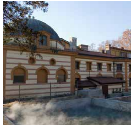
Чифте баня, Кюстендил

отделения – мъжко и женско, всяко от които има по три басейна. Банята се захранва с топла минерална вода. Банята се използва и днес, и е предназначена и за балнеология. Около нея е устроен паркът „Банска градина“ с декоративни дървета и цветни лехи.