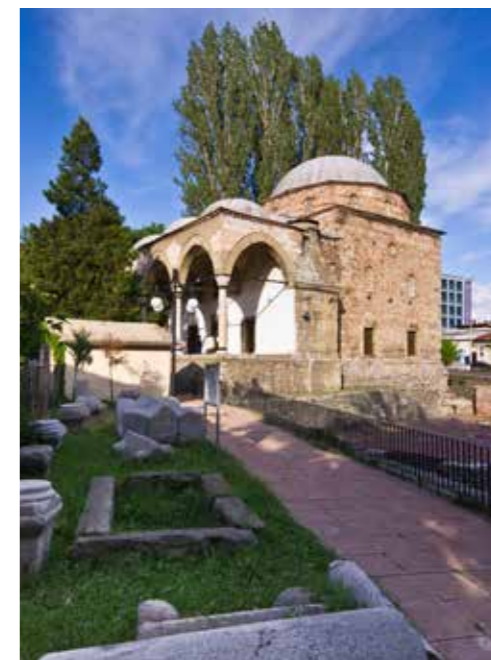
Ахмед бей джамия, Кюстендил

„Ахмед бей“ джамия, известна още и като „Инджили“, „Ингилиз“ или „Християнската джамия“ (на турски: Ahmed Bey Camii) е джамия в град Кюстендил, България. Джамията се намира в централната част на град Кюстендил, в съседство с римските терми. Джамията не функционира и понастоящем е изложбена зала на музея в Кюстендил. Построена е към средата на 15 век. На североизточната и стена стоят датите 1575 г. и 1577 г., но същите вероятно касаят по-късни реконструкции. Според предания е изградена върху основите на средновековната българска църква „Света Неделя“. Джамията е внушителна сграда с широк купол и мраморни стълбове и подпори. Входната аркада, покрита с три малки купола, е запазена в оригиналния си вид. Фасадите са разнообразни с островърхи арки – ниши над прозоречните отвори. Джамията е строена с каменни блокове и тухли от по-ранни епохи. Отличава се с декоративна тухлена украса, характерна за средновековната българска архитектура – корниз „вълчи зъб“, тухлена орнаментика и др.