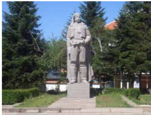
Паметник Ильо Войвода

Паметникът на Ильо войвода се намира непосредствено до Къщата-музей на Ильо Войвода в Кюстендил. Илия Марков Попгеоргиев, по-известен като Ильо войвода, Ильо Малешевски или Дядо Ильо, е български хайдушки войвода и е известен борец за освобождението на българите от Македония. Често е определян и като „последния хайдутин“.