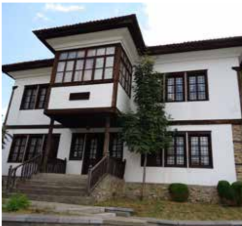
Къща музей “Ильо Войвода” Кюстендил

от XV век до Освобождението и приноса му за освобождението и обединението на българския народ в края на XIX и началото на XX век. Къщата е паметник на културата.