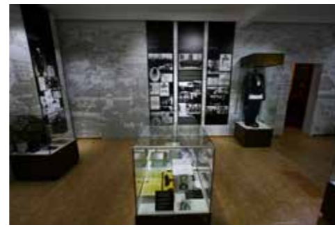
Къща музей „Димитър Пешев“, Кюстендил