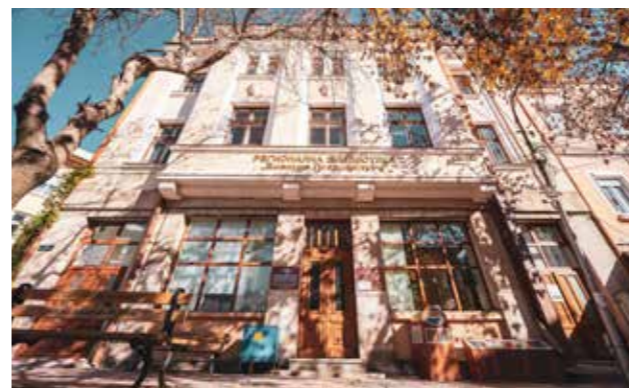
Регионална библиотека “Емануил Попдимитров”, Кюстендил

Регионална библиотека „Емануил Попдимитров“ се намира в централната част на Кюстендил, на ул. „Любен Каравелов“ № 1. Тя е най-голямата общодостъпна научна библиотека на територията на Област Кюстендил. През 1869 г. в Кюстендил се създава читалище „Братство“. Почти всички средства се използват за закупуване на книги, вестници и списания, с които се създава първия читалищен библиотечен фонд. Библиотеката в съвременния си вид е създадена в изпълнение на