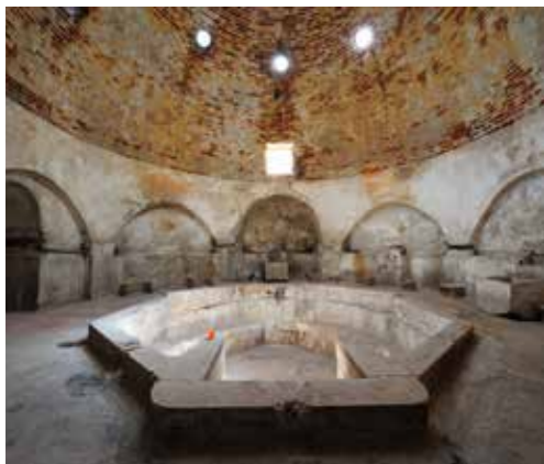
Дервиш баня Кюстендил

Дервиш баня е средновековна османска обществена баня в град Кюстендил. Завършването на строителството ѝ съвпада със смъртта на Сюлейман Великолепни през „великолепния век“. Намира се в централната част на град Кюстендил. Построена е през 1566 г., видно от цифров надпис от червени тухли на фасадната стена на банята. Върху същата фасадна стена са