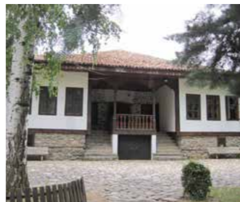
Килийно училище, Кюстендил

Първото българско училище в града е построено през 1820 г. в непосредствена близост до черквата „Успение Богородично“. То е било килийно училище (начално училище през османското иго до създаването на взаимните училища). Помещавало се е в едностайна сграда, а издръжката е давана от църковните приходи. Учебното съдържание имало религиозен характер, преподавало се на