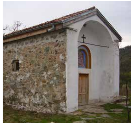
Църква „Свети Архангел Михаил“ село Горановци

църквата е била част от малък манастир. Не са запазени исторически данни за времето на основаването му. В подробния османски регистър за Кюстендилския санджак от 1570 г. манастирът е описан като действащ и заедно със с. Горановци е в състава на нахията Ълъджа (Кюстендил)