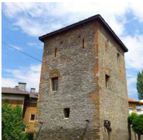
Пиргова кула, Кюстендил

Пирговата кула е средновековна отбранителна кула в град Кюстендил. Намира се в центъра на Кюстендил, до градската „Чифте баня“ и джамията „Ахмед бей“. Названието „Пиргова“ произхожда от гръцката дума – „пиргос“, което означава кула. Състои се от приземие и три етажа. Строена е с