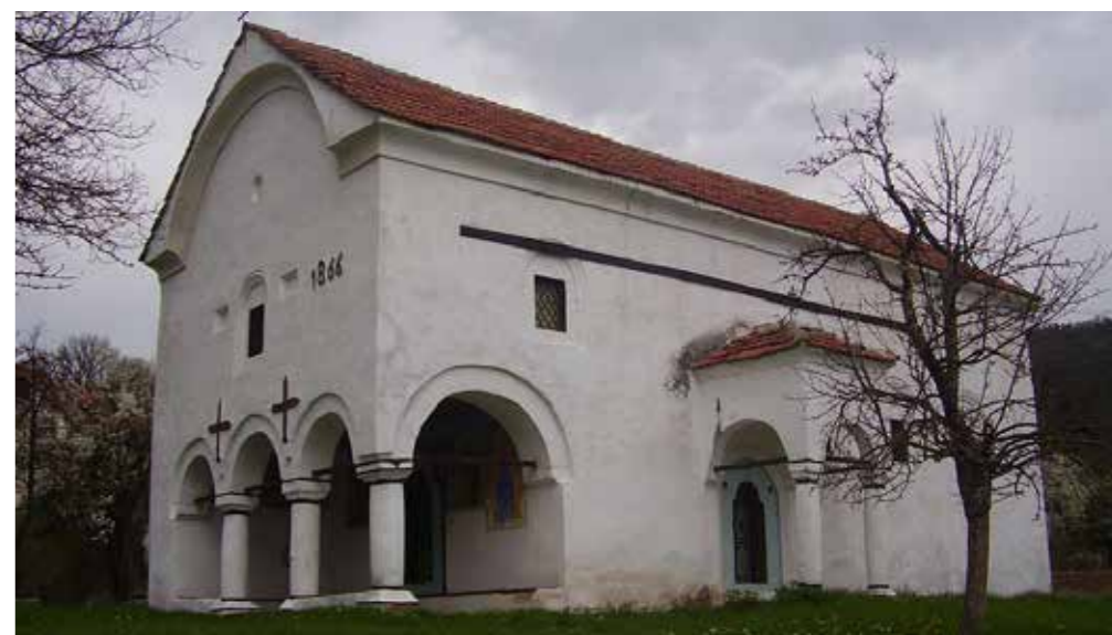
През 1886 г. е построена църквата „Свети Георги“, изписана от Евстатий Попдимитров.